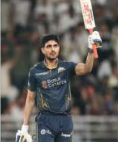
2023 सीजन में मुम्बई इंडियंस के खिलाफ 129 रन की पारी के दौरान 49 गेंदों में बनकर था। शुभमन से पहले

मोहाना (एजेंसी)। गुजरात टाइटंस के कप्तान शुभमन गिल ने राजस्थान रॉयल्स के खिलाफ दूसरे क्वालिफायर मुकाबले में शतकीय पारी खेलकर अपनी टीम को जीत दिलाने के दौरान एक आठम रिकार्ड भी अपने नाम किया है। शुभमन ने अपने पारी में 47 गेंदों पर ही 100 रन बना दिये। इससे वह आईपीएल प्लेऑफ में सबसे तेज शतक लगाने वाले खिलाड़ी बन गये हैं। इस मैच में 215 रन के विशाल लक्ष्य का पीछा करते हुए गिल ने यह मैच विजेता पारी खेली, जिसने गुजरात फाइनल में पहुंचे। इस मुकाबले में शुभमन ने 53 गेंदों में 104 रन बनाये। इसमें 15 शानदार चौके और तीन छके शामिल थे। यह आईपीएल में शुभमन का कुल पांचवां शतक है, जबकि कप्तान के तौर पर इस लीग में यह उनका दूसरा शतक है। इस दौरान उनकी और सई सुदर्शन के बीच हुई पहले विकेट के लिए 160 रन की साझेदारी हुई। इस शतक के साथ ही शुभमन आईपीएल प्लेऑफ के इतिहास में सबसे तेज शतक लगाने वाले खिलाड़ी बन गये। इस प्रकार उन्होंने अपना हो खिलाट रिकार्ड तोड़ा, जो उन्होंने