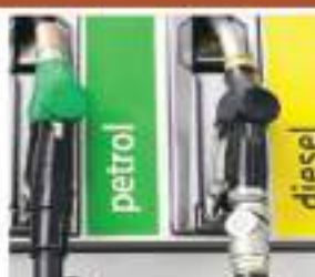
पेट्रोल 111.18 रुपये और डीजल 97.83 रुपये प्रति लीटर, चेन्नई में पेट्रोल 108.01 रुपये और डीजल 99.78 रुपये प्रति लीटर और कोलकाता में पेट्रोल 113.47 रुपये और डीजल 99.82 रुपये प्रति लीटर है।

सरकारी तेल कंपनियों ने दिहे ली-मुंबई जैसे देश के चारों महानगरों में पेट्रोल-डीजल के दाम नहीं बदले हैं। सरकारी तेल कंपनियों के अनुसार, गाजिकबाद में पेट्रोल 15 पैसे महंगा होकर 101.88 रुपये लीटर हो गया है तो डीजल 14 पैसे बढ़त के साथ 95.362 रुपये लीटर पहुंच गया है। नोएडा में पेट्रोल 46 पैसे सस्ते ता होकर 101.96 रुपये लीटर बिक रहा है तो डीजल 42 पैसे गिरावट के साथ 95.44 रुपये लीटर के भाव पहुंच गया है। बिहार की राजधानी पटना में पेट्रोल 17 पैसे महंगा होकर 113.54 रुपये लीटर हो गया तो डीजल 18 पैसे महंगा होकर 99.54 रुपये लीटर बिक रहा है। कच्चे तेल ने 24 घंटे में इसकी कीमतों में भी गिरावट दिख रही है। वैश्विक बाजार में बेंट क्रूड का भाव करीब 2 डॉलर टूटकर 93.09 डॉलर प्रति बैरल पहुंच गया है। छे दे यूटीआई का भाव भी गिरा है और वैश्विक बाजार के भाव 90.54 डॉलर प्रति बैरल के अंक चल रहा है। दिल्ली में पेट्रोल के भाव 102.12 रुपये और डीजल 95.20 रुपये प्रति लीटर, मुंबई में