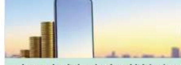
मोबाइल उपभोक्तकों को अपने 3 से 6 महीनों में रिचार्ज करना महंगा पड़ सकता है। एक टेलीकॉम एनालिस्ट के मुताबिक टैरिफ में करीब 10 फीसदी बढ़ोतरी हो सकती है। उन्होंने कहा कि महंगे प्लान्स की ओर ग्राहकों के बढ़ने से कंपनियों का एअरट्राफ भी लगातार बढ़ रहा है, जबकि भारती एयरटेल की फंड जुटाने की संभावनाएं भी मजबूत दिख रही हैं। उनका कहना है कि महंगाई से जुड़ी चिंताओं के बावजूद टैरिफ बढ़ोतरी को ज्यादा समय तक टाला जाना मुश्किल दिख रहा है। उन्होंने यह भी कहा कि टेलीकॉम कंपनियों को बहुत बड़ी सौदों में टैरिफ बढ़ाकर का असर एक्सपेंडेबल पर यूजर पर कभी पॉजिटिव रहा है। यानी कंपनियां सीमित टैरिफ बढ़ोतरी के जरिए भी अपनी प्रति ग्रहक कमाई में अच्छी बढ़ोतरी करने में सफल रही हैं।