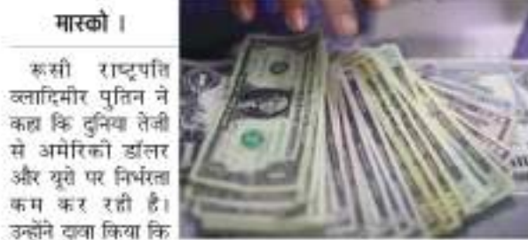
रूसी राष्ट्रपति व्लादिमीर पुतिन ने कहा कि दुनिया तेजी से अमेरिकी डॉलर और यूरो पर निर्भरता कम कर रही है। उन्होंने कहा कि प्रतिबंधों, संपत्तियों को फ्रीज करने और वित्तीय दबाव की वजह से कई देश अब अपनी राष्ट्रीय मुद्राओं में व्यापार को प्राथमिकता दे रहे हैं। सेंट पीटर्सबर्ग इंटरनेशनल इकानोमिक्स फोरम (एसपीआईएफ) में बोलते हुए पुतिन ने कहा कि रूस के विदेशी मुद्रा भंडार और संपत्तियों को फ्रीज किए जाने से दुनिया के कई देशों का पश्चिमी वित्तीय प्रणाली पर भरोसा कमजोर हुआ है। उन्होंने कहा कि जब किसी देश की वैध संपत्तियों तक पहुंच ठेकी जा सकती है, तो अन्य देश भी अपने वित्तीय भविष्य को लेकर चिंतित हो जाते हैं। इसी कारण कैस्पियन भुगतान प्रणालियों और स्थानीय मुद्राओं का उपयोग बढ़ रहा है। पुतिन ने कहा कि रूस अपने प्रमुख व्यापारिक साझेदारों के साथ स्थानीय मुद्राओं में व्यापार बढ़ रहा है। उनके अनुसार रूस के कुल निर्यात का लगभग 65 फीसदी लेन-देन अब रूसियन रूबल में हो रहा है। डिजिटल वित्तीय परिसंपत्तियों और केंद्रीय बैंक डिजिटल करेंसों का उपयोग भी तेजी से बढ़ रहा है। पुतिन ने आरोप लगाया कि पश्चिमी देश अंतरराष्ट्रीय वित्तीय व्यवस्था का राजनीतिक ढंढंधार के रूप में इस्तेमाल कर रहे हैं। उन्होंने कहा कि जब तक वैश्विक संस्थाओं और नियमों से पश्चिमी देशों को फायदा हुआ, तब तक उन्होंने उनका समर्थन किया, लेकिन प्रतिस्पर्धा बढ़ने पर खुद उन नियमों से पीछे हटने लगे। रूसी राष्ट्रपति ने कहा कि वैश्विक व्यापार का केंद्र अब पश्चिम से हटकर पूर्व और दक्षिण की ओर बढ़ रहा है। उन्होंने जिन प्रमुख मार्गों का उल्लेख किया, उनमें शामिल हैं- नॉर्थ-साउथ ट्रांसस्पेंट कारिडोर, ट्रांस-आर्कटिक रुट, कैस्पियन सागर व्यापार मार्ग, मध्य एशिया और मध्य पूर्व को जोड़ने वाले नए कॉरिडोर।