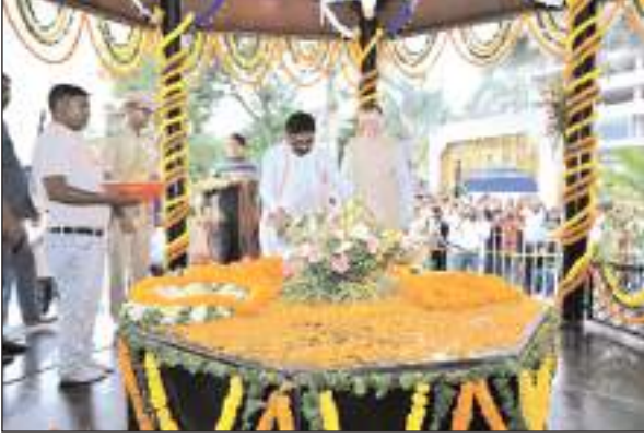
ह्रसवा सौ साल बाद भी प्रासंगिक हैं बिरसाह्र इस अवसर पर मुख्यमंत्री हेमंत

इसके बाद राज्यपाल एवं मुख्यमंत्री बिरसा चौक पहुंचे। वहां भगवान बिरसा मुंडा की प्रतिमा पर पुष्प अर्पित कर कोटि-कोटि नमन किया। इस दौरान दोनों नेताओं ने बिरसा मुंडा के व्यक्तित्व एवं कृतित्व को याद किया।